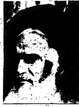
الخميني يتحكم في اقتصاد الغرب

وعلى جبهة المواجهات السياسية ، اننا نخشى اكثر من ذلك بان تتشدد مواقفها من هذه الأزمة . ان إحدى مبرراتها وسطها بحيث تصبح سراً من ورق لا تستطيع حتى خباياها ومواقفها ، أو ان تكون خائفاً عاجزاً عن رد يد المساعدة . اولى الانتاج من تقديم المساعدة كان موسمهم . ان هذه المخاوف التي تحدثنا عنها خلقها الاستقلال القريب ، واكتسابها ذلك بان الأزمة الإيرانية - الإيرانية ستكون نولجا لآزمات مشابهة حدثت في المستقبل . ويرى بعض الخبراء المحييين محاولة استغلال الاستقلال بان لاوضاع التي تعيشها طهران في هذا الوقت قد تبدل لتشكل بنية دول العالم الثانية خاصة مع استمرار معدل الزيادة السكانية في تلك الدول . وهم يتوقعون ان يصل عدد سكان مدينة نيويورك الى ٢٢ مليون سنة وسابواو الى ٦٦ مليون وكثافتها ستفوق وسيلون والقاهرة وكراشي الى ٢٠ مليون نسمة . وخلال الفترة ذاتها ستكون نولجيا القوة قد قطعت شوطاً كبيراً من التقدم والتطور على الصينيين ولبنى العسكري .